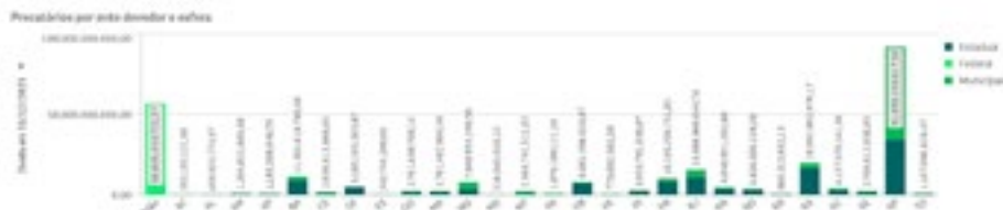
Figura 1 – Precatórios por ente devedor e esfera