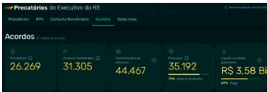
Figura 2 – Portal de Precatórios do Executivo do RS

Em 2024 foi lançado o Portal de Pagamento dos Precatórios, uma plataforma que disponibilizou aos cidadãos informações sobre pagamento das dívidas em precatórios. Recentemente, foi apresentado no South Summit Brasil 11 a nova denominação deste portal, que passou a se chamar Portal de Precatórios do Executivo do RS. Os resultados da 8ª rodada de conciliação estão lá disponíveis: